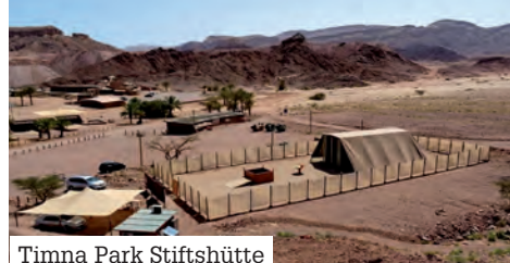
Timna Park Stiftshütte