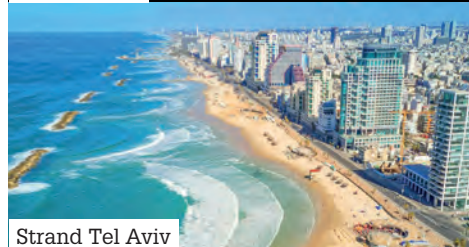
Strand Tel Aviv