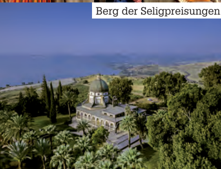
Berg der Seligpreisungen